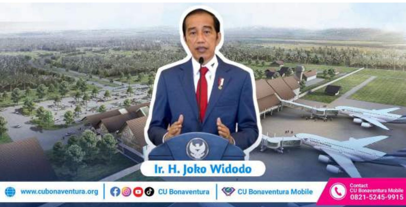
Ir. H. Joko Widodo

Warga Kota Singkawang dan sekitarnya patut berbangga. Bandar Udara yang mulai dibangun sejak tahun 2019, kini sudah diresmikan oleh Presiden RI Joko Widodo (20/03/2024).