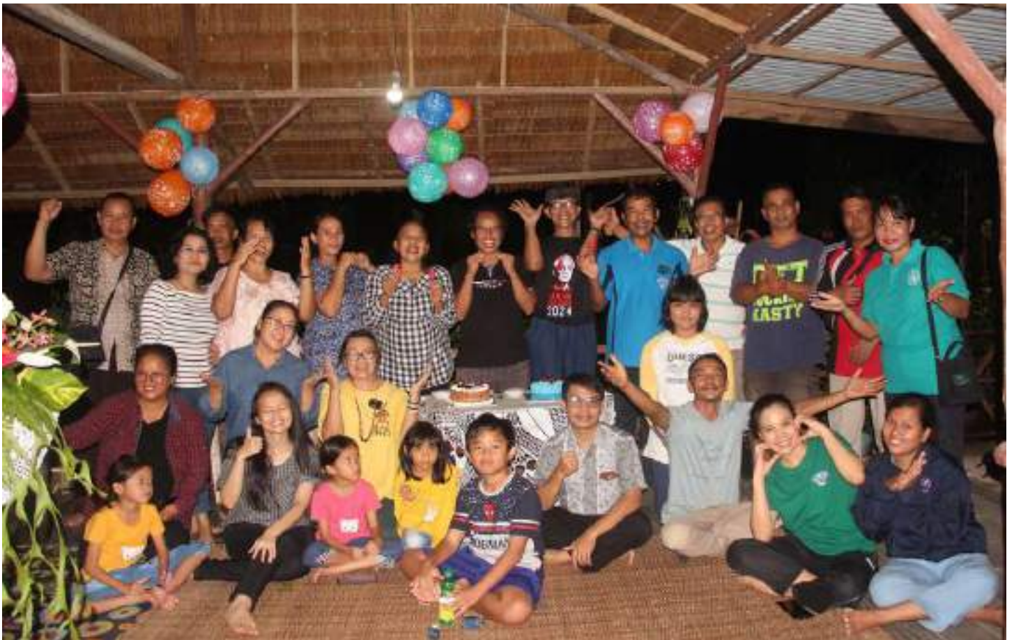
Doc. Perayaan HUT Komunitas Pemberdayaan Bukit Rayo