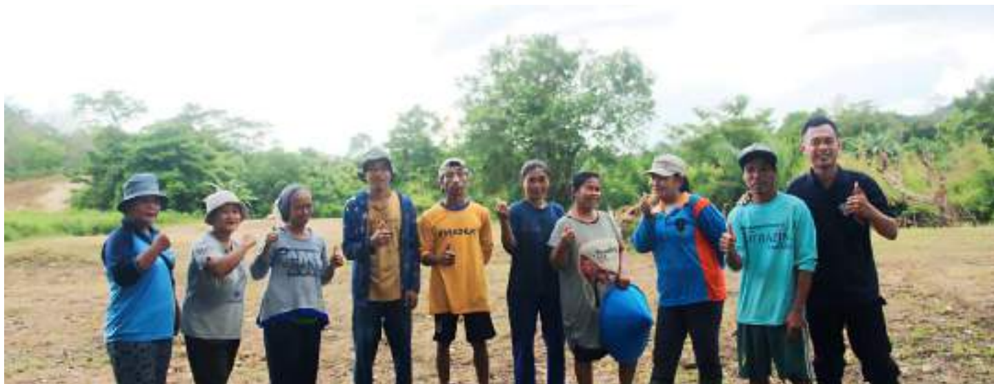
Doc. Budidaya Jagung Komunitas Pemberdayaan PADAGI

Komunitas Pemberdayaan CU BONAVENTURA adalah kelompok anggota yang sudah terorganisasi, memiliki pengurus dan anggota, serta memiliki program kerja pemberdayaan untuk mencapai peningkatan kualitas hidup anggota. Sedangkan Pemberdayaan adalah proses penyadaran peningkatan kualitas hidup, agar anggota berperan aktif mengembangkan dirinya dengan memanfaatkan potensi diri dan lingkungan melalui kegiatan-kegiatan pemberdayaan atas dasar saling percaya, saling mengenal, dan saling menolong, pemberdayaan mungkin berfokus pada peningkatan kualitas di berbagai aspek kehidupan, seperti Ekonomi, Pendidikan, Kesehatan, Lingkungan, atau Sosial.